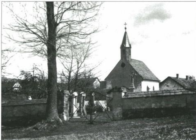
Kostel sv. Jana a Pavla s hřbitovem na Štolnavě, počátek 60. let 20. století.